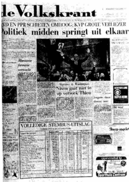
Einde van de KVP, De Volkskrant, 1972.

Binnen de politieke verhoudingen van dat moment was deze uitslag uiterst onduidelijk. Het wederom grote verlies van de KVP,