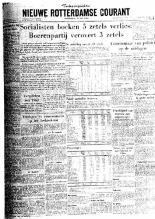
Aankondiging van veranderingen, NRC, 1963.

renpartij, behaalden gezamenlijk meer dan 5% der stemmen. Op basis van deze verkiezingsuitslag continueerden de KVP, ARP, CHU en VVD hun samenwerking en kon het Kabinet-Markies van Vlieland van start gaan.