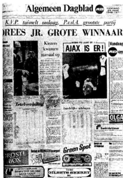
Geen opkomstplicht, Algemeen Dagblad, 1971.