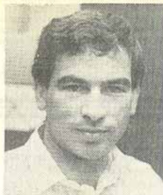
Maurice de Hond

personen van 65 jaar en ouder. Daaruit blijkt dat bejaarden die zichzelf rooms-katholiek of gereformeerd noemen, voor het overgrote deel nog altijd op een confessionele partij (in dit geval het CDA) stemmen. Vergelijken we dit beeld met een NIPO-onderzoek uit 1954, dan blijkt dat de mensen, die toen 34 jaar of ouder waren en op een confessionele partij stemden, op dit moment nog steeds hetzelfde stemgedrag vertonen. Onder confessionele 65-plussers heeft de ontzuiling dus niet toegeslagen.